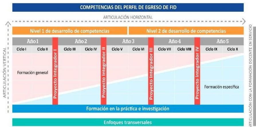
Figura 5 Organización de los proyectos integradores