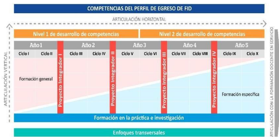
Figura 5 Organización de los proyectos integradores