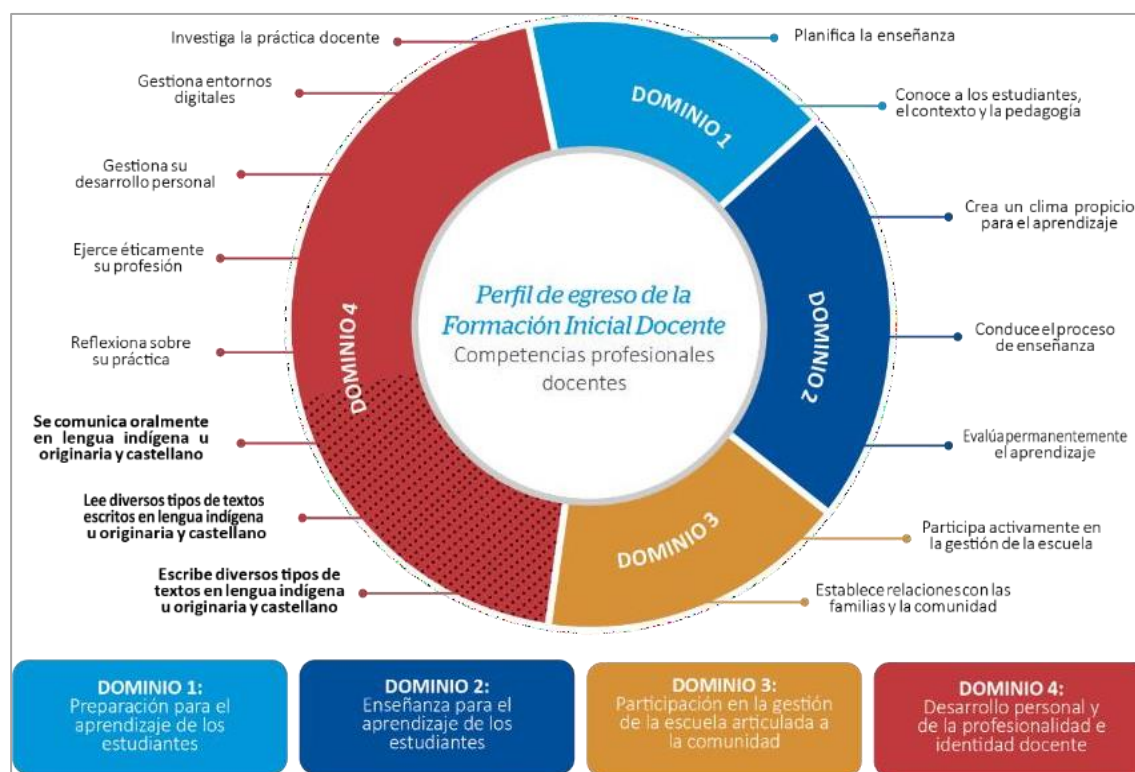
Figura 1 Esquema del Perfil de egreso de la Formación Inicial Docente