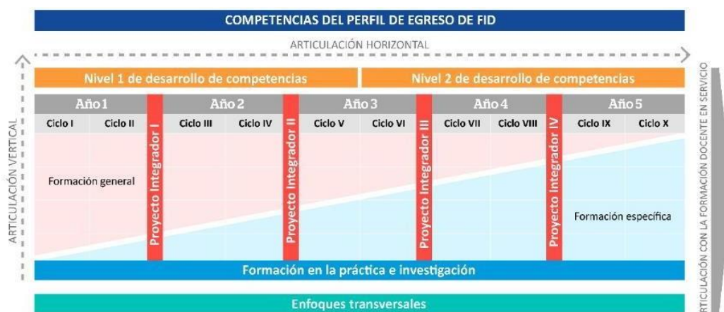
Figura 5 Organización de los proyectos integradores